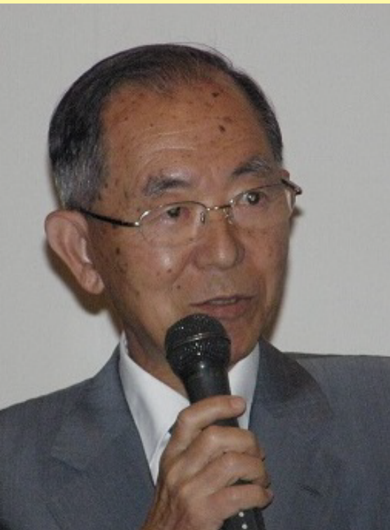
丹羽宇一郎さん 2013年6月29日 横浜での講演会